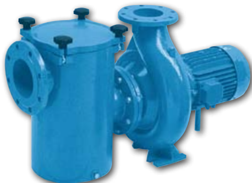
Мощность насосов 1,5-11,2 кВт

Выпускаемые Pahlen центробежные насосы типа FD-H оснащены большим, удобным для чистки предфильтром. Этот насос предназначен для перекачивания больших объемов воды с низким противодавлением. Корпус насоса FD-H и его предфильтр из чугуна, рабочее колесо изготовлено из бронзы и закреплено на стержне из нерж. стали, а уплотнения внутри насоса - керамические. Фильтрующая корзина - из нержавеющей стали. Эти насосы также могут изготавливаться из бронзы. IP55.